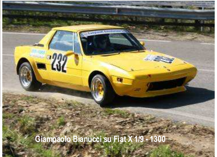
Giampaolo Bianucci su Fiat X 1/9 - 1300

con la Fiat 128 Rally dopo averne saltata qualcuna, non ha perso lo smalto dei tempi miglio-