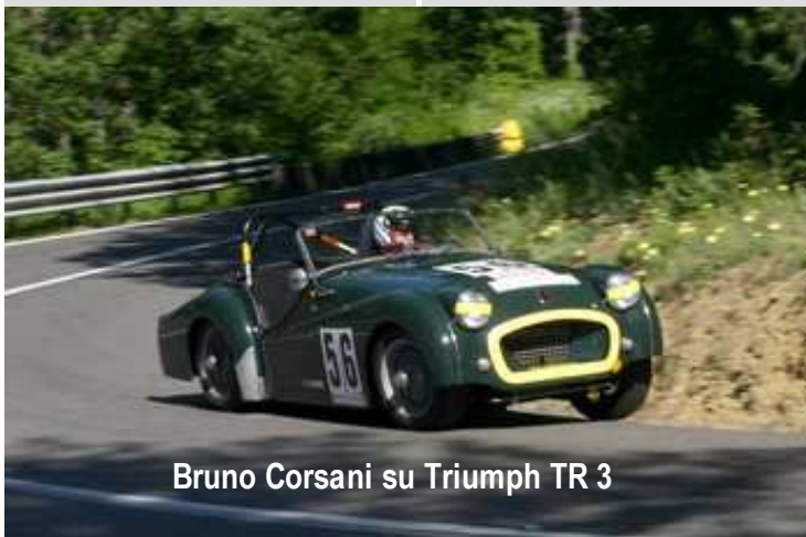
Bruno Corsani su Triumph TR 3

parte dovuto alla particolare situazione economica che stia-