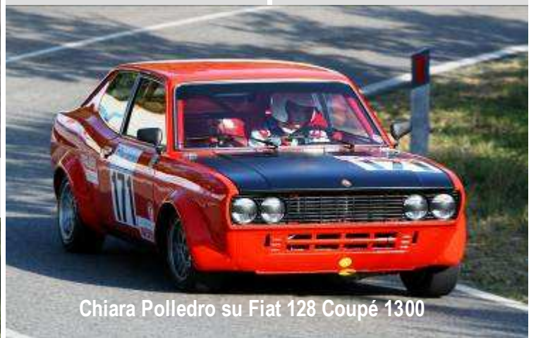
Chiara Polledro su Fiat 128 Coupé 1300

Senza commenti la perentoria affermazione di Chiara Polledro